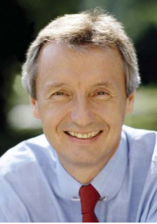
Bundesminister Martin Bartenstein

Unser Ziel als Bundesregierung ist es, dass jeder und jede Betreuungs- und Pflegebedürftige ganz nach seinen/ihren Vorstellungen die bestmögliche Form der Betreuung erhalten kann. Dazu gehört auch die Möglichkeit der Rund-um-die-Uhr-Betreuung daheim.